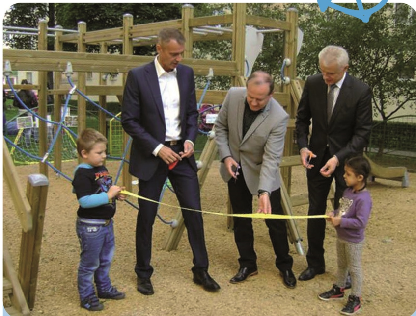
Otvorenie detského ihriska na Rastislavovej ulici v KE