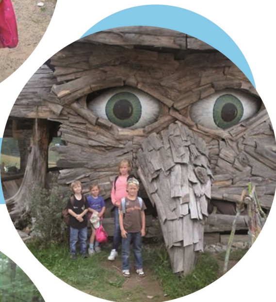
Dobšinské rozprávkové mesteško Habakuky